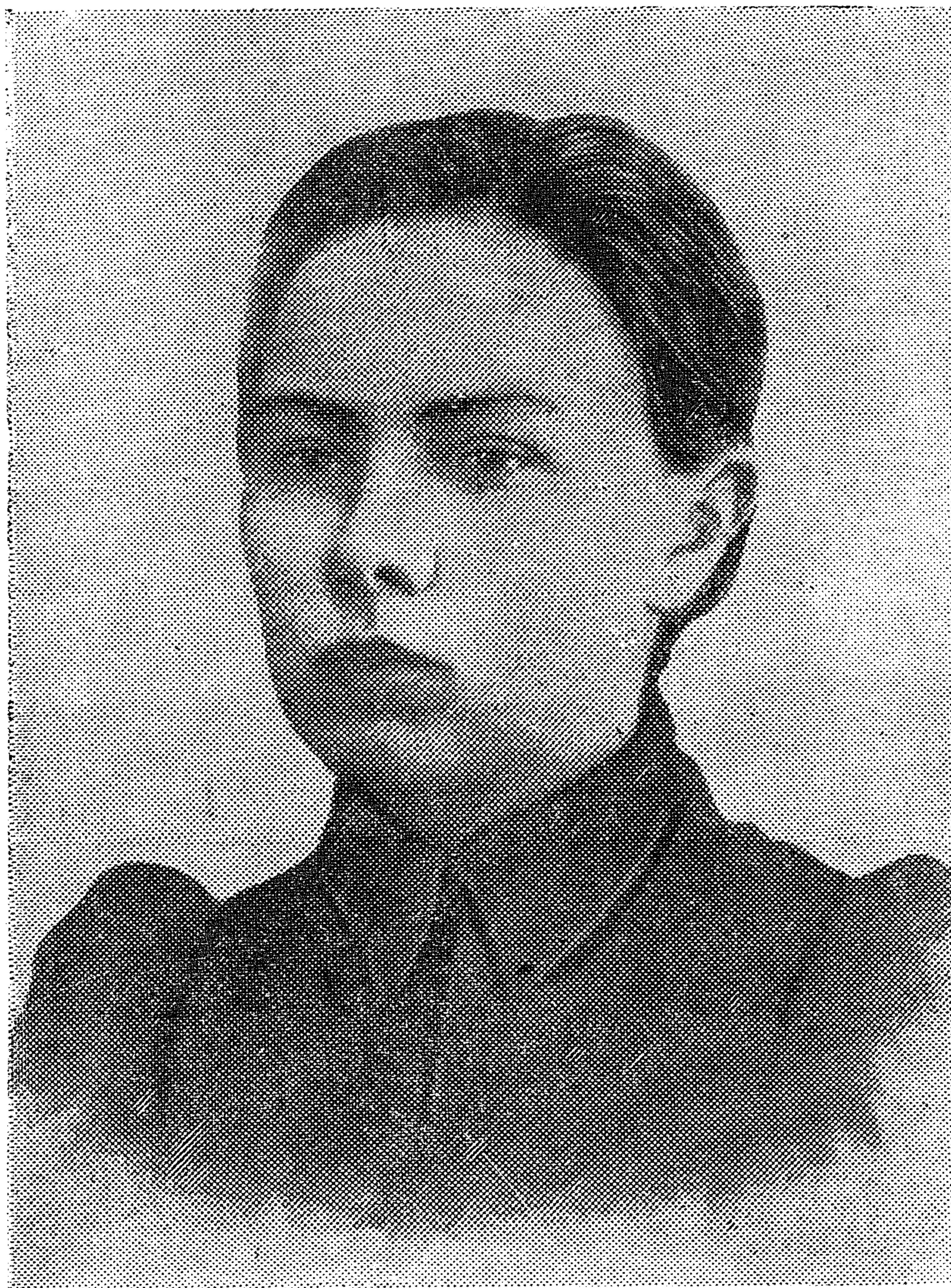
Надежда Константиновна Крупская в молодые годы.

Надежда Константиновна Крупская прошла замечательный жизненный путь большевика. Свидетельница и участница зарождения великой партии большевиков, она под знаменем Ленина—Сталина около пяти десятилетий боролась за дело рабочего класса и дожила до всемирно-исторических побед социализма. В этих победах много труда Надежды Константиновны, светлый образ которой будет вечно жить в сердцах трудящихся.